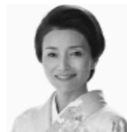
仁科 亜季子 さん 女優、東京都出身。91年子宮頸がんが見つかり、闘病生活をおくる。現在、映画・テレビ・舞台などで活躍するかわら、がんと闘病など 自らの体験を生かして講演、執筆など幅広く活動。